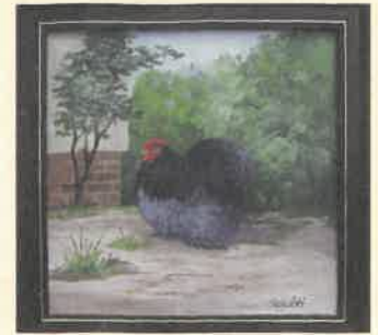
Dieses Gemälde wird zur nächsten HSS im Januar 2008 auf die Blauen vergeben

Ein zu heller Halsbehang ist gleichzusetzen mit verwaschenem Blau. Erwähnt werden soll noch, dass sich dieser deutlich dunklere Behang nicht auf wenige Zentimeter um den Kopf herum beschränken, sondern tatsächlich das Halsgefieder umfassen soll. Dieses Farbbild ist keine Utopie, sondern wurde von mehreren Züchtern in früheren Jahren häufig gezeigt und solche Tiere sind auch heute vorhanden.