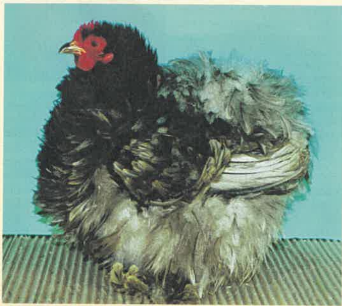
0,1 Zwerg-Cochin, blau, gelockt, HSS Weißandt-Görlitz 2006, sg 95 SE (Werner Schnabel, Großröhrsdorf)