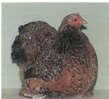
0,1 Zwerg-Cochin, porzellanfarbig, BR 96, aus der Zucht von Christoph Sicking, Stadtlohn.

Faszinierend sind sie ja, diese mit vielen, wie kleine Blumen aussehende, Farbpunkten übersäten Zwerg-Cochin. Nicht von ungefähr wurde früher dieser Farbenschlag als »Mille Fleur« (tausend bunte Blumen) bezeichnet. Bei den Zwerg-Cochin gehört er zu den erst vor kurzem zur Anerkennung gebrachten Farbtupfern im bunten Strauß der Federbälle.