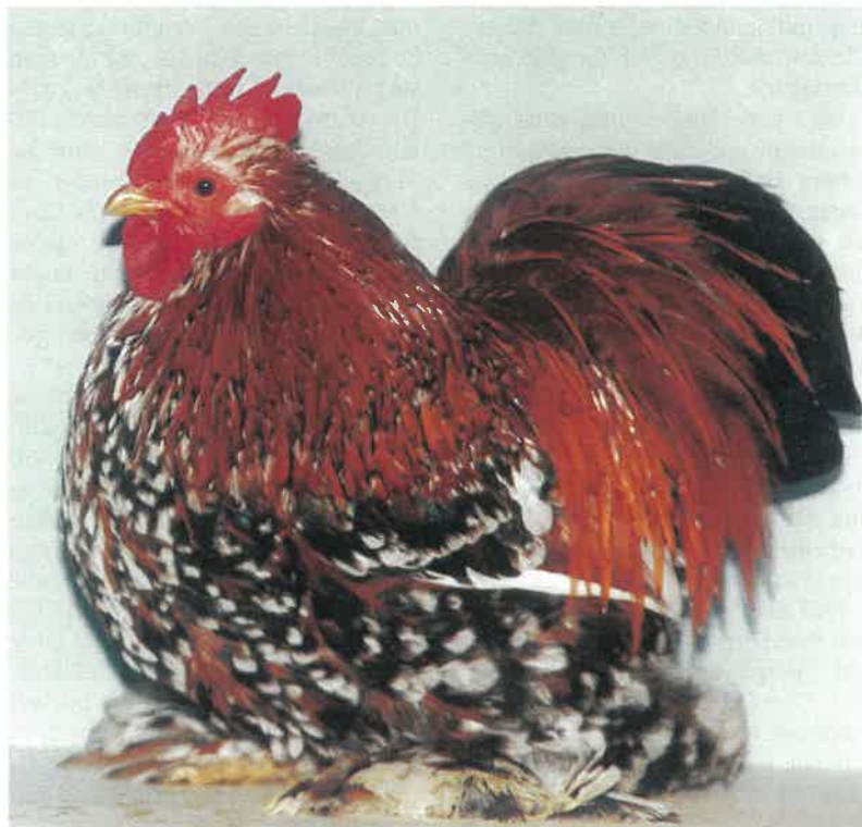
1,0 Zwerg-Cochin, porzellanfarbig, BR 95, aus der Zucht von Christoph Sicking, Stadtlohn.

Aufschlussreich sind da die Aufzeichnungen von Zuchtfreund Sicking, der von Anfang an alles schriftlich festgehalten hat: »Im Jahre 1983 begann die Zucht durch den Erwerb von 1,1 Zwerg-Cochin des Jahrgangs 1981, die ursprünglich aus der Zucht