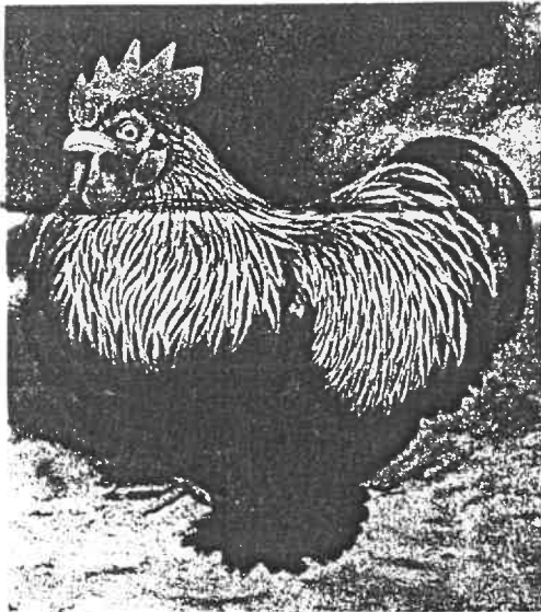
Rebhuhnfarb. Zwerg-Cochin-Hahn aus dem Jahre 1922. Z.: Landsperger. Nach dem Leben gemalt von K. Zander.

Ein Stamm „rebhuhnfarbiger“ Zwerg-Cochin bevölkerte vor 50 Jahren eine meiner zahlreichen Votieren. Er stammte von Gieche, Forst, der sich damals bereits mit der Zucht goldfarbiger Zwerg-Phönix beschäftigte. Das sei hier um dieser Seltenheit willen festgehalten. Aber wie so ganz anders in jedweder Beziehung war mein Stämmchen gegenüber unserem heutigen Material! Der Vergleich fällt nicht zu seinen Gunsten aus. Die Tiere waren sehr klein, hat-